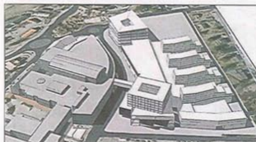
BY. Arkitektfirmaet Hille-Melbye står bak denne skissen, med to høye hus på hver side av kvartalet. Eksisterende storsenter til venstre.

– Jeg er fascinert av Urbaniks skisse, men uansett resultat får vi her utvidet sentrumsområdet med park og boliger.